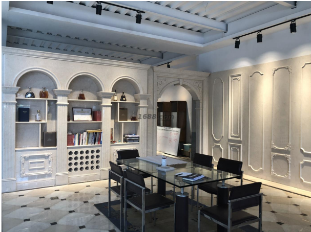
名称: 石材背景墙 近1年销量: 200000 平方米 货品来源: 工厂货源