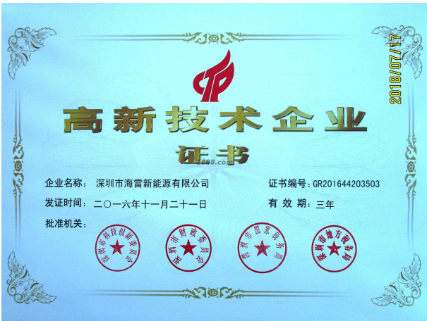
其他证书证明材料