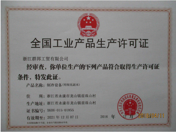
经营许可证明材料