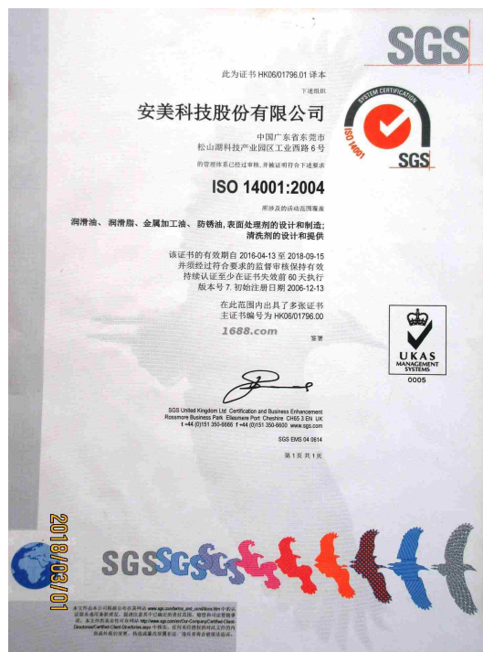
产品体系证书证明材料