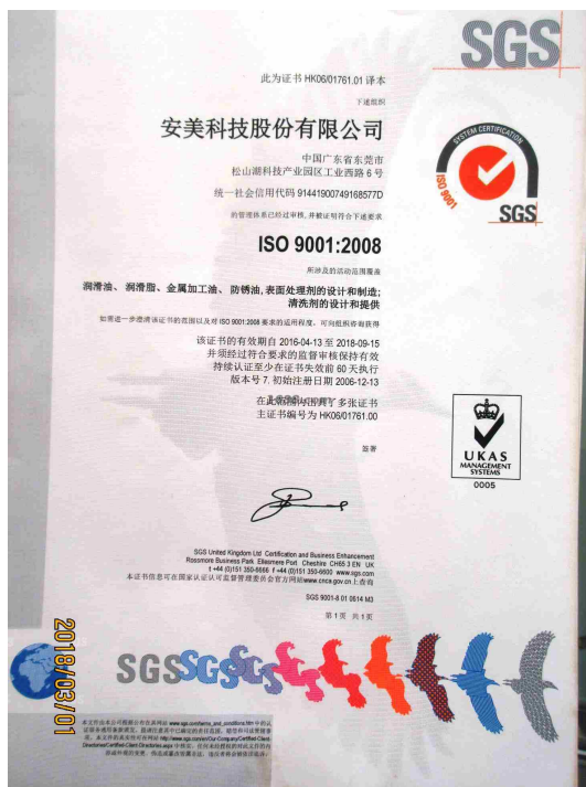
产品体系证书证明材料