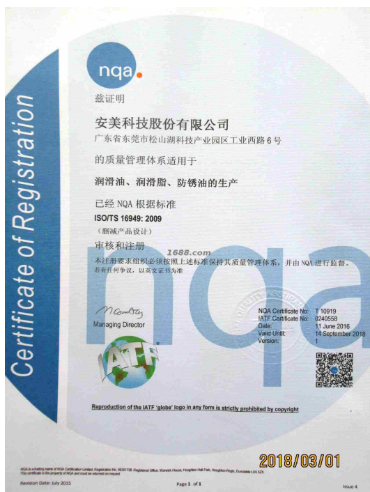
产品体系证书证明材料