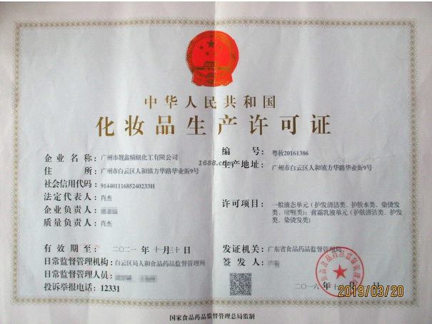
经营许可证证明材料