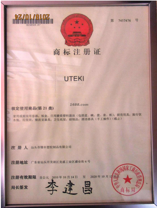
自有品牌证明材料