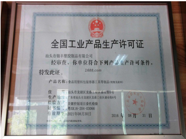
经营许可证证明材料