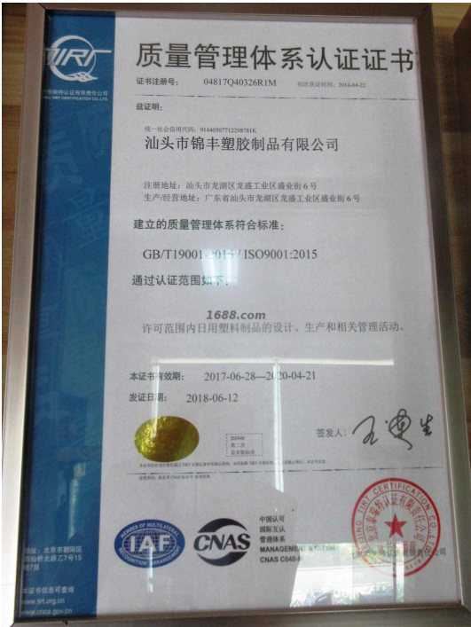
产品体系证书证明材料