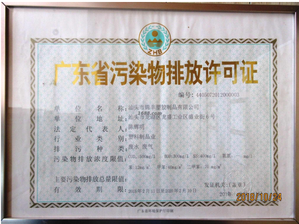
经营许可证证明材料