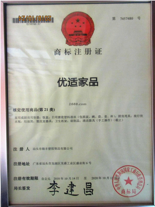
自有品牌证明材料