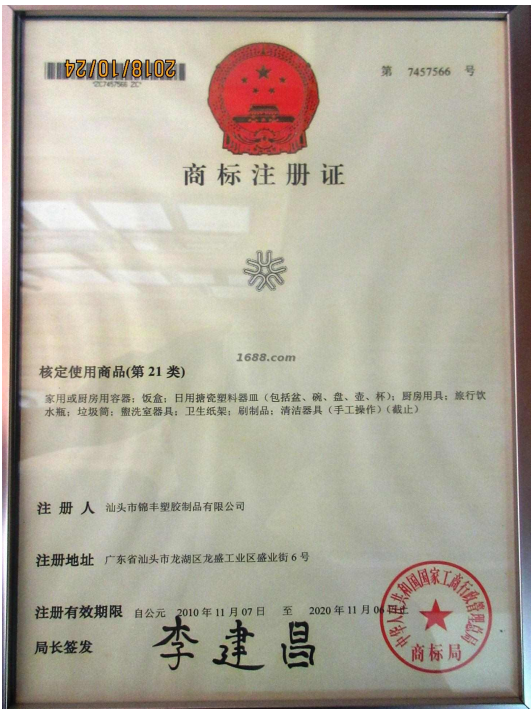
自有品牌证明材料