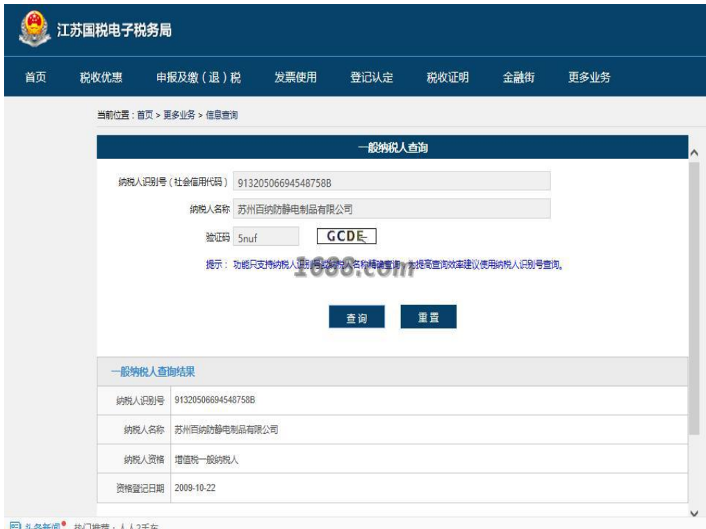
一般纳税人证明材料

组织机构名称： 苏州百纳防静电制品有限公司 组织机构代码： 91320506694548758B 有效期： 2009-09-23 - 长期