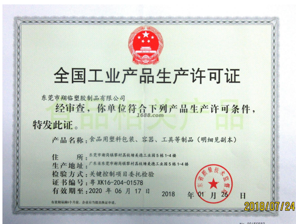
经营许可证明材料