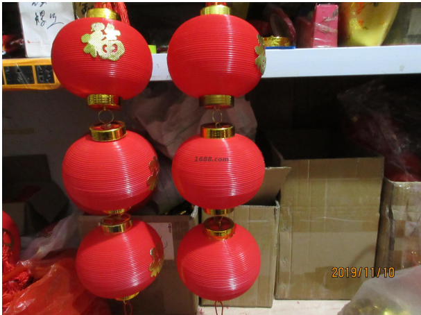
名称: 工艺品 货品来源: 工厂货源