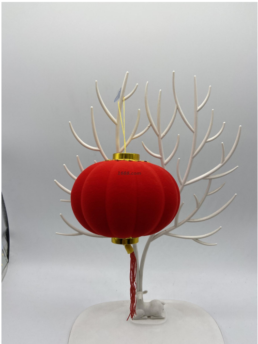
名称: 工艺品 货品来源: 工厂货源