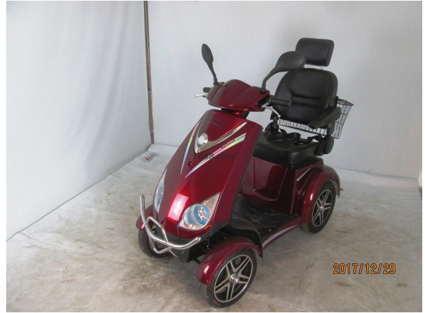
名称： 休闲电动四轮车