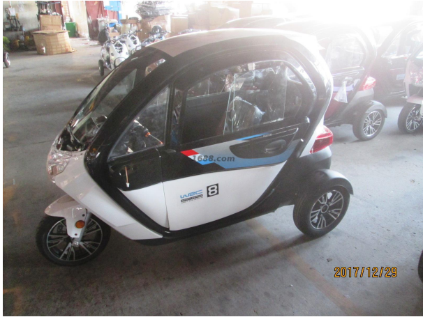
名称： 休闲电动三轮车