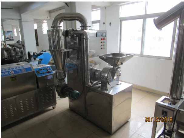
名称: 中草药粉碎机组