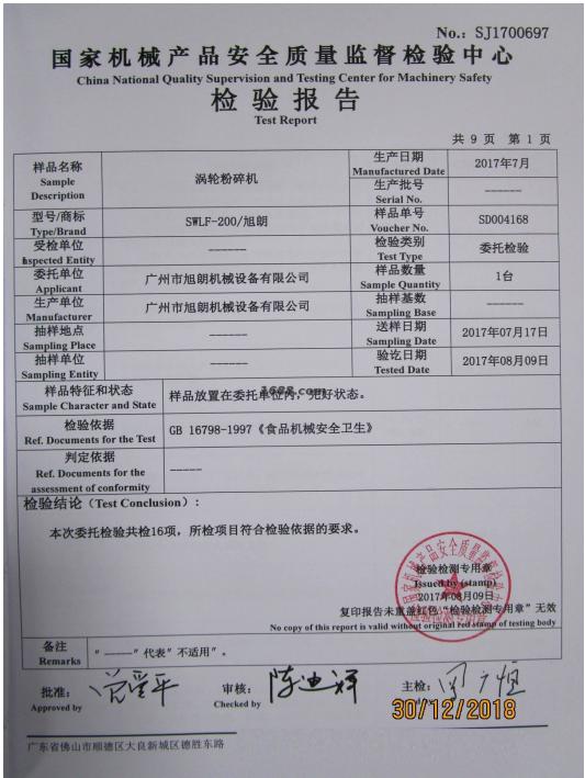
第三方产品质检报告

第三方质检产品名： 涡轮粉碎机 第三方检测机构名： 国家机械产品安全质量监督检验中心