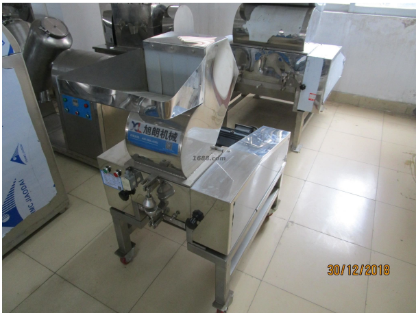
名称: 不锈钢破碎机