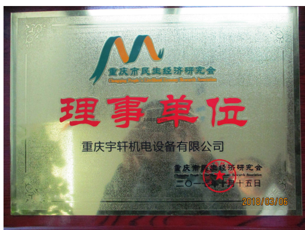
其他证书证明材料