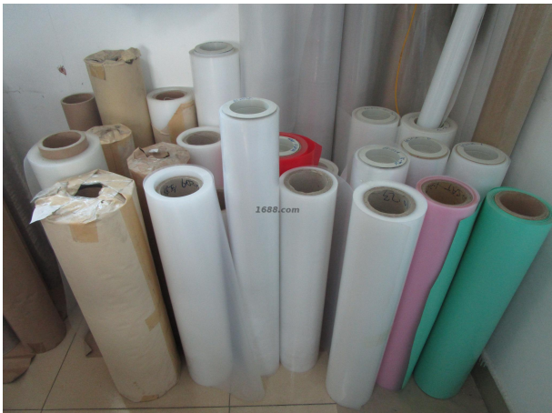
名称：电路板真空包装膜