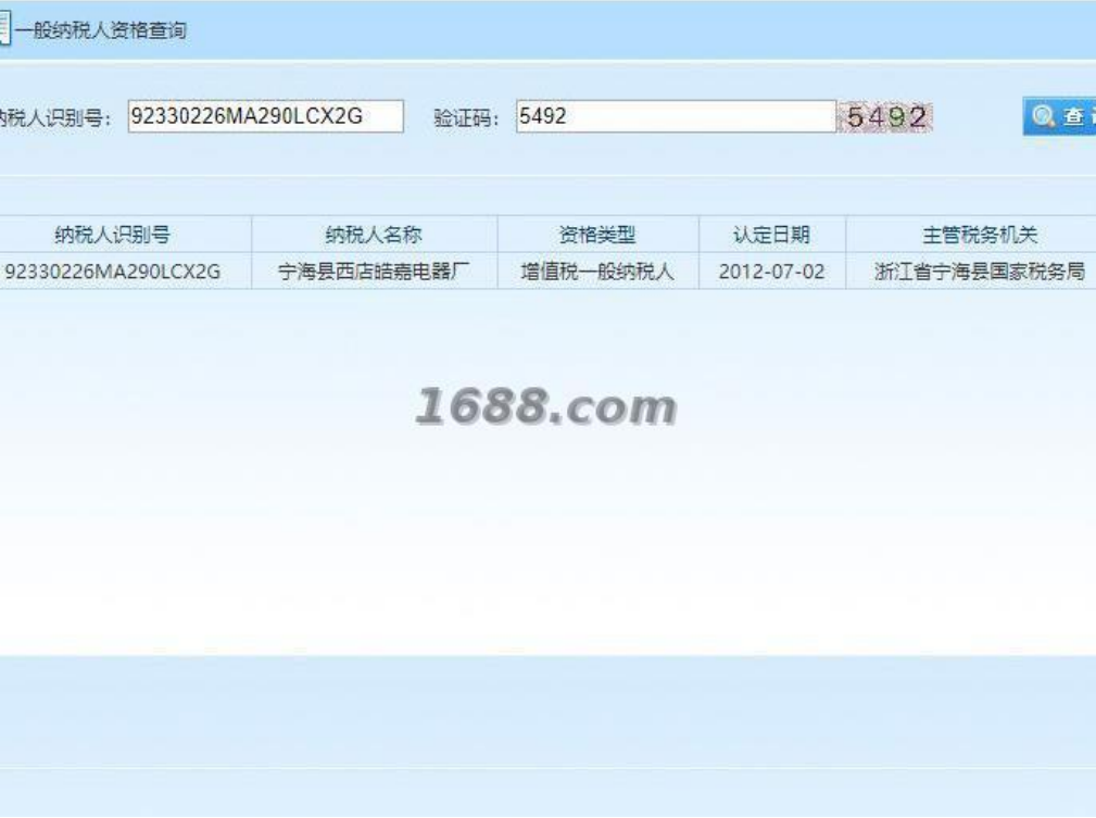
一般纳税人证明材料