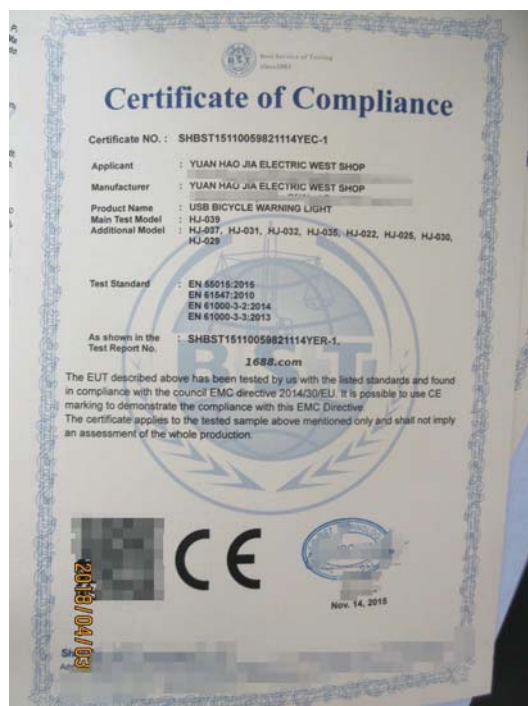
产品体系证书证明材料