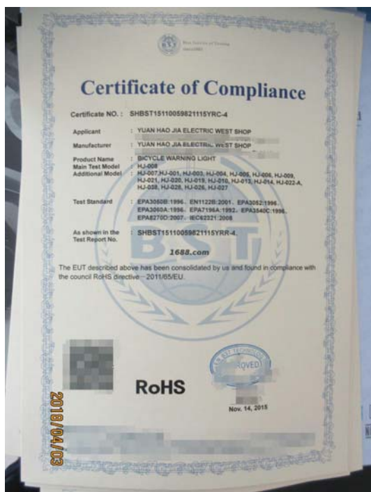
产品体系证书证明材料