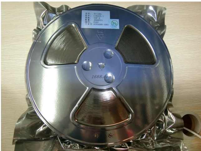
名称: 集成IC 近1年销量: 10000000 个