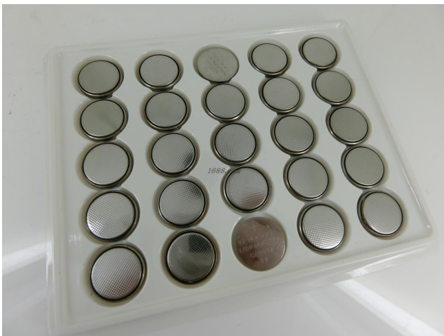
名称: 纽扣电池CR2032 近1年销量: 5000000 个