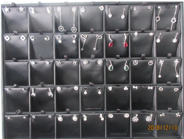
名称: 纯银镶石耳钉