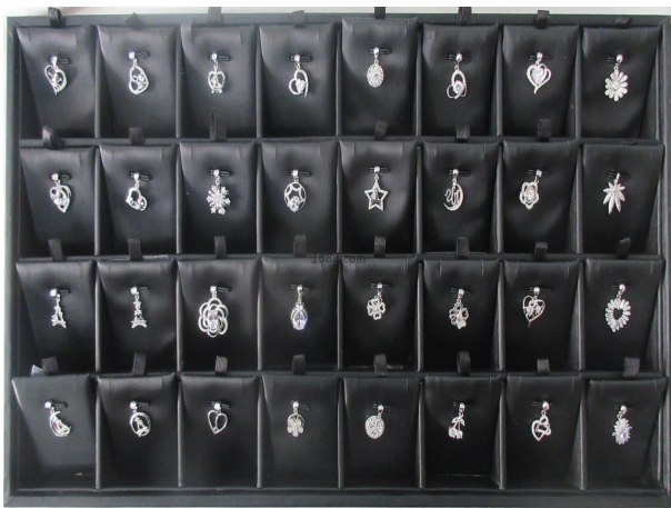
名称: 纯银镶石吊坠