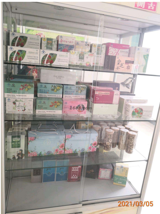
名称: 保健食品 近1年销量: 1500000 盒 货品来源: 工厂货源