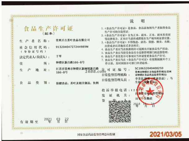
经营许可证明材料