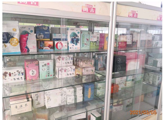
名称: 调味茶 近1年销量: 500000 盒 货品来源: 工厂货源