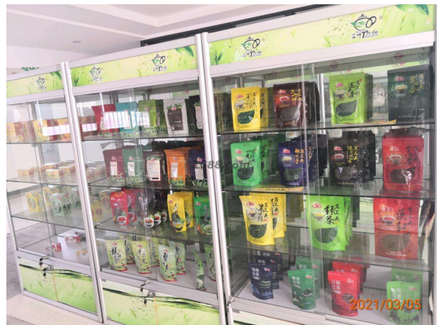
名称: 原叶茶 近1年销量: 500000 盒 货品来源: 工厂货源