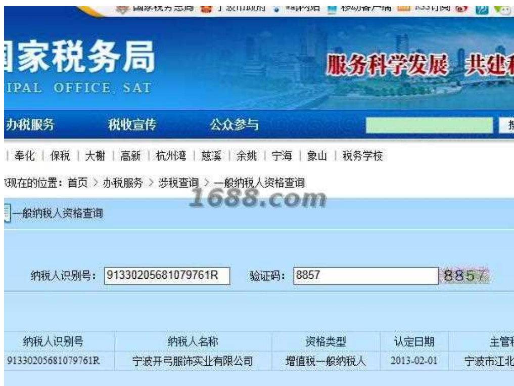
一般纳税人证明材料