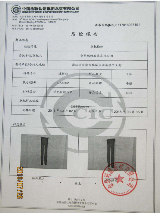
第三方产品质检报告