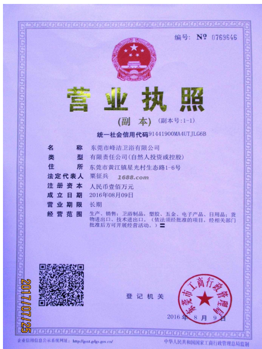
关联工厂营业执照