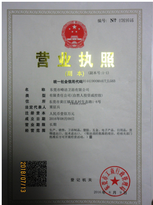
关联工厂营业执照