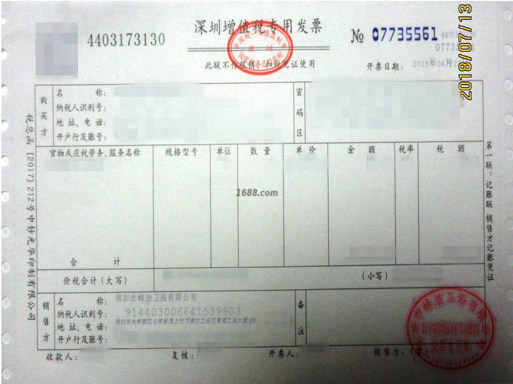
一般纳税人证明材料