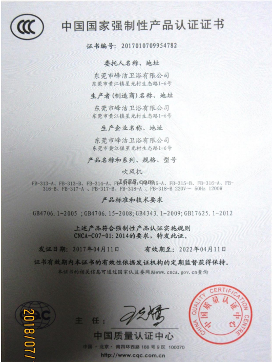
产品体系证书证明材料