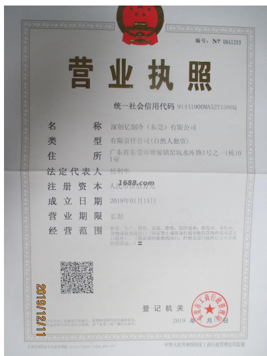
关联工厂营业执照