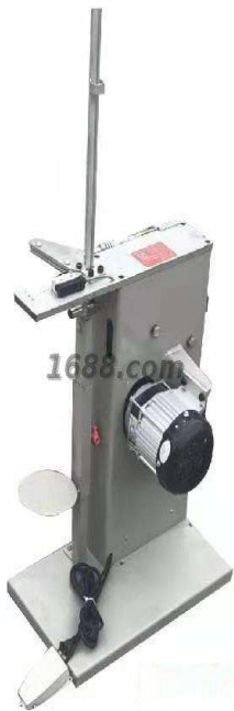
名称: 扎口机 近1年销量: 166 套 货品来源: 工厂货源