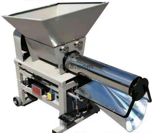
名称: 装袋机 近1年销量: 260 套 货品来源: 工厂货源