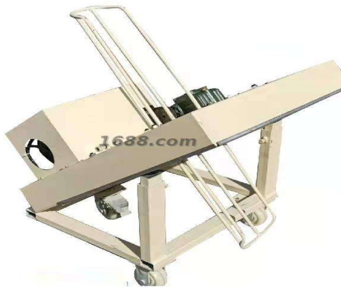
名称: 刺孔机 近1年销量: 300 套 货品来源: 工厂货源