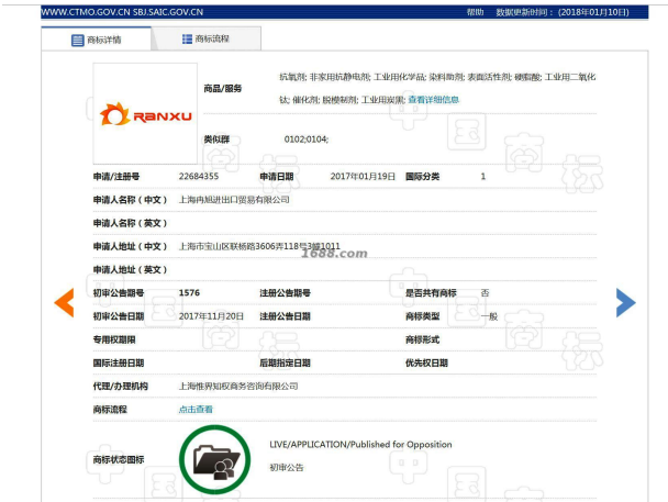
代理品牌证明材料