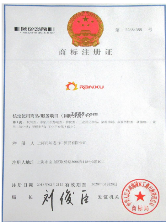
代理品牌证明材料