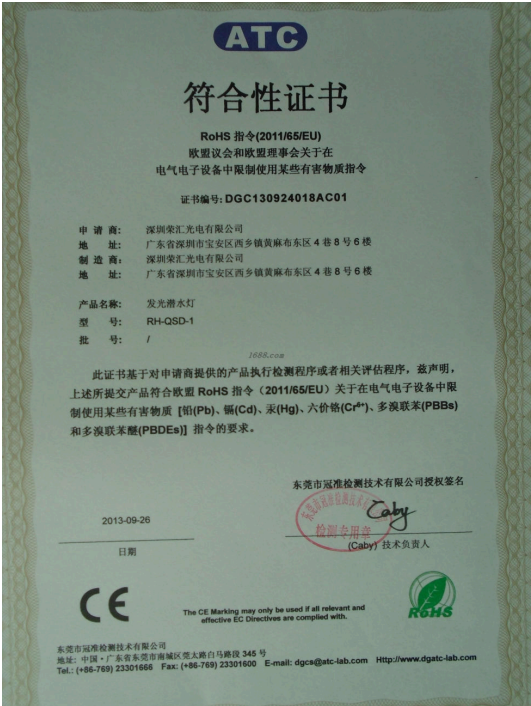
产品体系证书证明材料