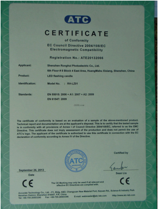
产品体系证书证明材料