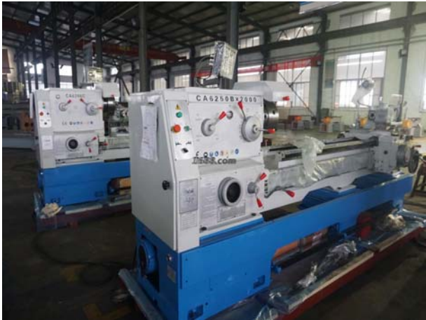
名称: 机床 近1年销量: 1838 台