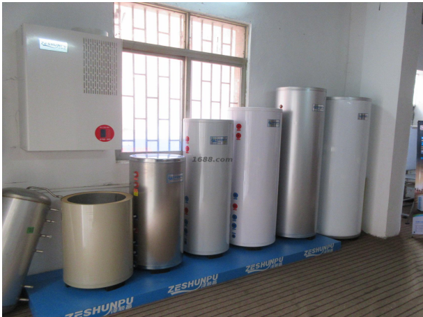
名称：家用空气能热水器