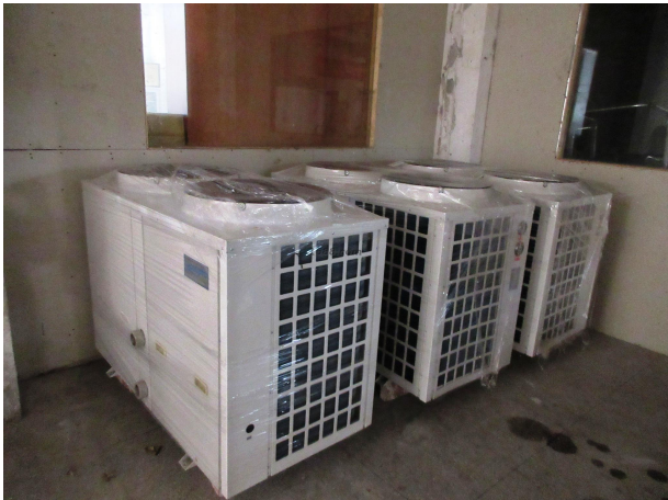
名称：商用空气能热水器