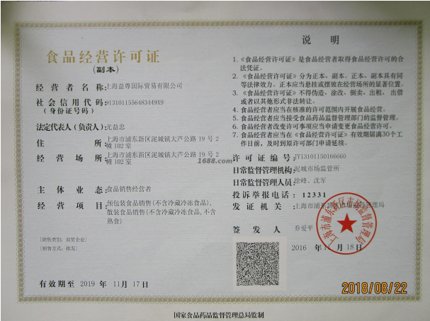
经营许可证明材料