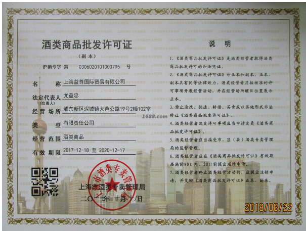
经营许可证证明材料