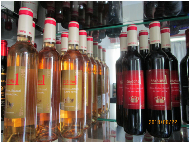
名称: 红酒 货品来源: 工厂货源

线上平台数量： 1 线上平台名单： 阿里巴巴平台 https://yizun2010.1688.com/