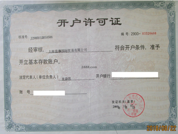
经营许可证明材料