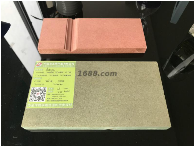
名称: 密度板制品 近1年销量: 2817300 立方