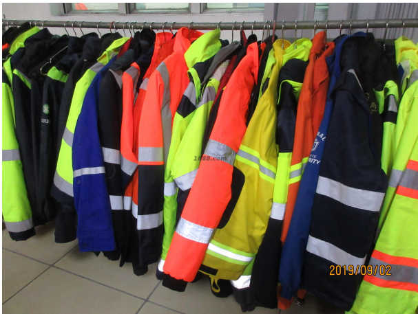
名称: 高亮见防水防酸碱制服