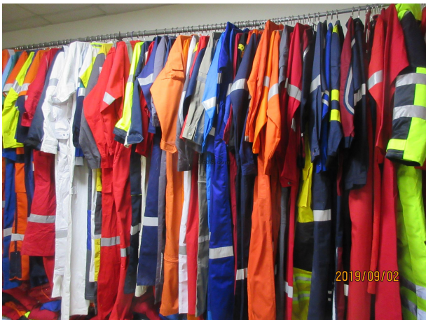
名称: 功能性防护服