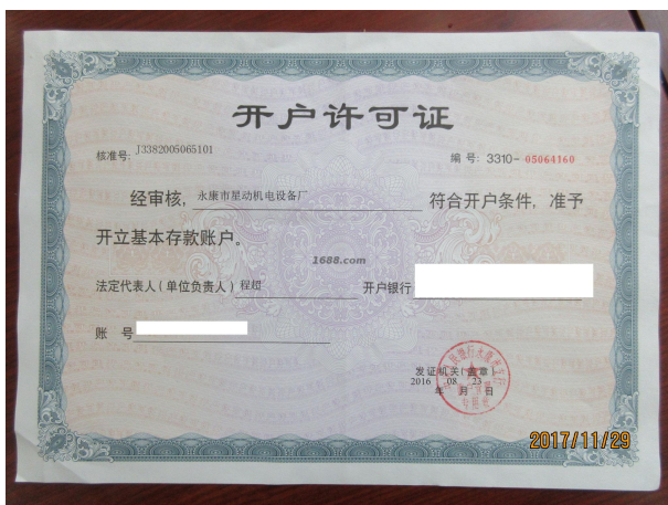
经营许可证证明材料